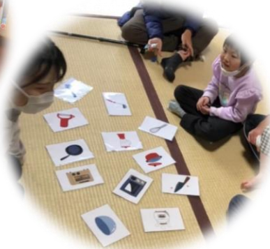
認知トレーニング